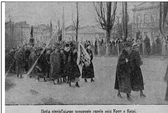
Похід візників під час поховань героїв знів Крут в Києві.

Уже в березні 1918 року, після підписання Берестейського миру, за німецької окупації України та з поверненням уряду УНР до Києва, за рішенням Центральної Ради від 19 березня 1918 року було вирішено урочисто перепоховати полеглих студентів на Аскольдовій Могилі в Києві. 19 березня о 14:00 колона візників із 26 трунами вирушила з вокзалу в бік Педагогічного музею, де містилася Центральна Рада. Там відбувся траурний мітинг, на якому виступали Михайло Грушевський, Аркадій Степаненко та інші політики, відбулася громадська жалоба.