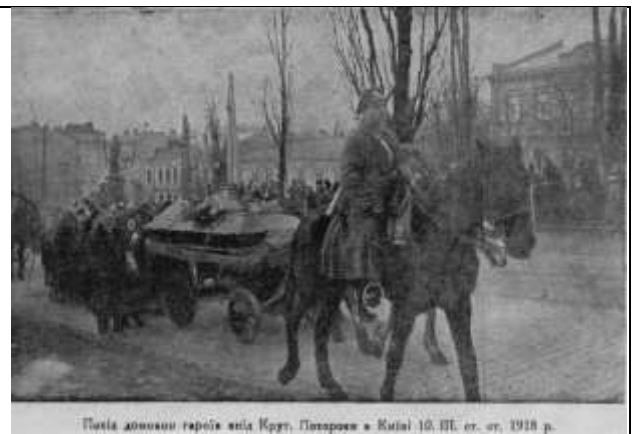
Похід домоколів героїв знів Крут, Плевранів в Києві 19. III. ст. ст. 1918 р.